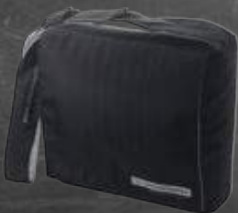
Maletín de transporte

El equipo funciona con 3 pilas AA estándar o mediante fuente de alimentación externa con aprobación médica. Las pilas tienen una duración de seis (6) meses.