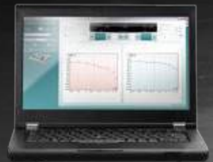
Software Diagnostic Suite (sólo AS608e)