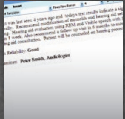
Página de informes del Diagnostic Suite (sólo AS608e)